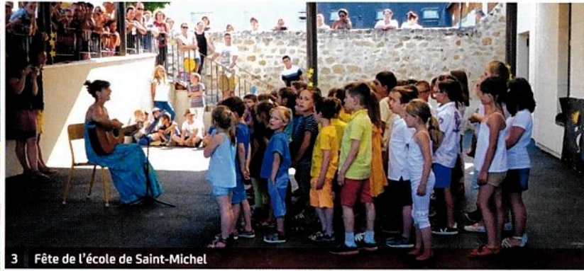
3 Fête de l'école de Saint-Michel