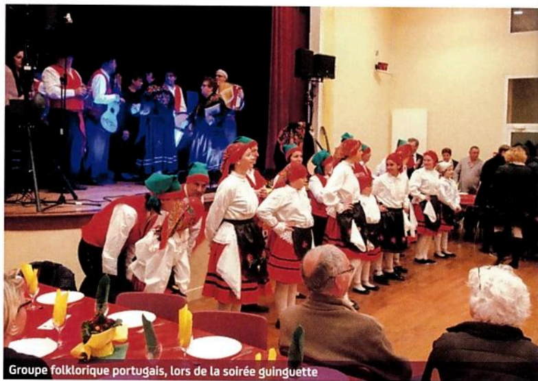
Groupe folklorique portugais, lors de la soirée guinguette