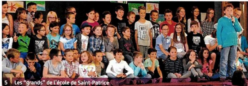
5 Les "grands" de l'école de Saint-Patrice