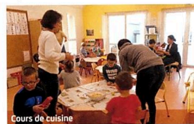
Cours de cuisine

Nous avons invité des parents d'élèves pour nous aider à tenir des ateliers cuisine, le vendredi 13 octobre. Les élèves ont épluché, coupé, lavé des légumes d'hiver. Nous les avons fait cuire, mixés, puis dégustés en fin de journée, en classe.