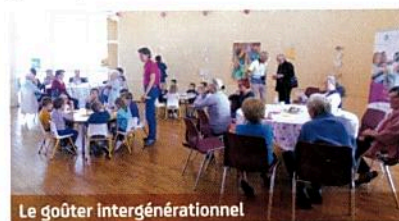
Le goûter intergénérationnel

d'Ingrandes. Les élèves ont apprécié les gâteaux, le chocolat maison et les chansons.