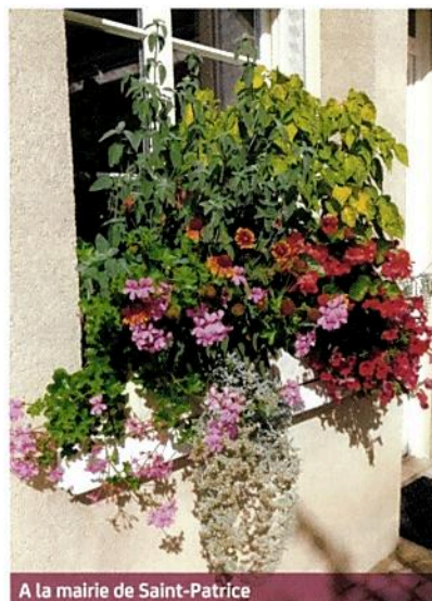
A la mairie de Saint-Patrice

Un grand merci à tous ceux qui ont planté, arrosé, entretenu tous les points fleuris de notre commune et ainsi contribué à l'embellissement de notre cadre de vie !