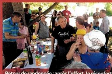
Retour de randonnée; après l'effort, le réconfort

Au cours de l'année 2017, le comité des fêtes a souhaité inscrire ses actions dans la commune nouvelle de Coteaux-sur-Loire.