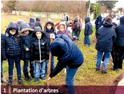
1 Plantation d'arbres

Les trois écoles de notre commune assurent la scolarité de l'entrée en maternelle jusqu'au CM 2, les petites et moyennes sections de maternelle étant implantées à Ingrandes, la grande section de maternelle, le CP et le CE 1 à Saint-Michel, et le CE 2, le CM 1 et le CM 2 à Saint-Patrice.