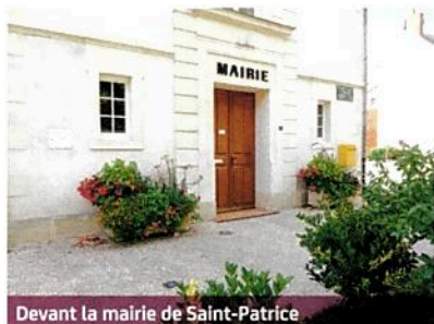
Devant la mairie de Saint-Patrice

Si la naissance de notre nouvelle commune a marqué le début de l'année 2017, ce sont les fleurs qui ont couronné notre mariage dès les beaux jours et ce durant toute la période estivale, jusqu'à l'arrivée des premiers frimas.