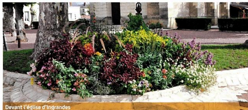
Devant l'église d'Ingrandes