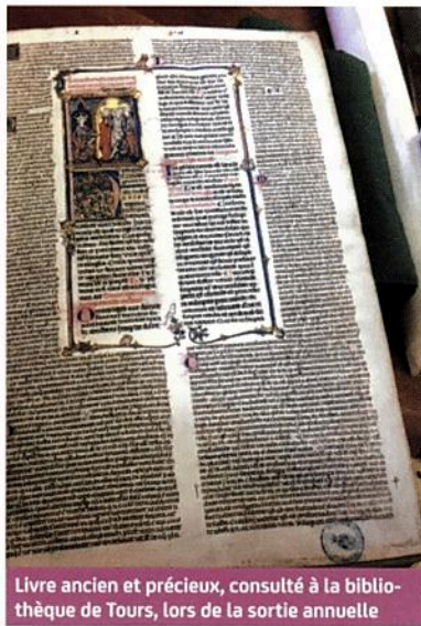
Livre ancien et précieux, consulté à la bibliothèque de Tours, lors de la sortie annuelle

Vous pouvez vous inscrire à tout moment ; 75 € par trimestre, séance découverte gratuite. Contact : Chantal au 02 47 97 00 39 ou 06 67 24 25 67 - chantal-brault@orange.fr