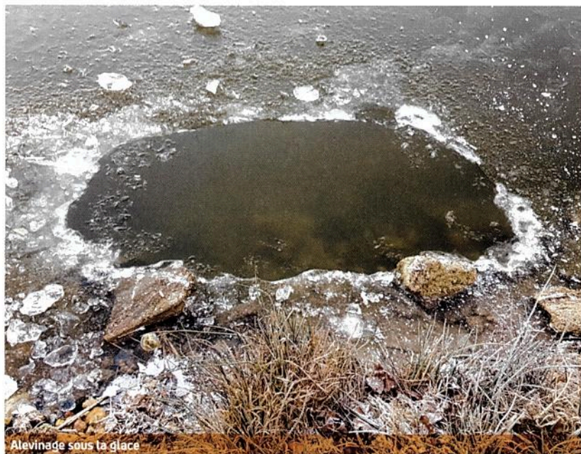
Alevinée sous la glace