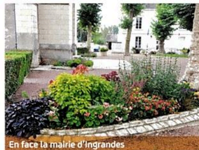
En face la mairie d'Ingrandes

Tous ces efforts de fleurissement ont été remarqués, par les habitants bien sûr, mais aussi par la Société d'Horticulture de Touraine (SHOT), mandatée par le Conseil départemental d'Indre-et-Loire, dans le cadre