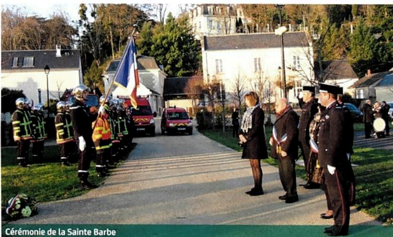
Cérémonie de la Sainte Barbe

Les sapeurs-pompiers remercient la population de Coteaux-sur-Loire pour l'accueil qu'elle leur réserve lors de la traditionnelle distribution des calendriers.