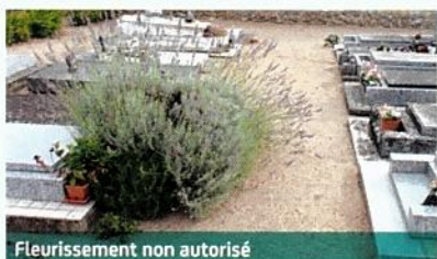
Fleurissement non autorisé