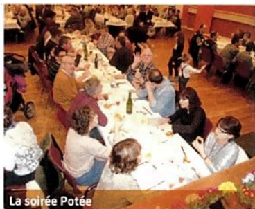
La soirée Potée

Merci aux bénévoles pour leur dévouement.