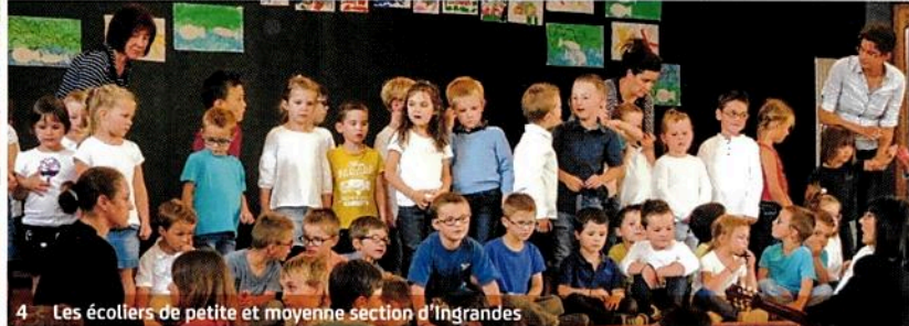
4 Les écoliers de petite et moyenne section d'Ingrandes