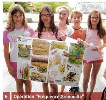
6 Opération "Fréquence Grenouille"

d'espaces naturels Centre-Val de Loire présente les travaux réalisés par les élèves de CM 2 à l'école de Saint-Patrice. Les enfants de CE 2 et CM 1 reçoivent des mains de leurs aînés de petits livrets de jeux, devinettes et charades réalisés par leurs soins, avant que tous se retrouvent pour partager un petit déjeuner très apprécié.