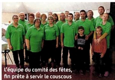
L'équipe du comité des fêtes, fin prête à servir le couscous

En 2017, comme chaque année, le comité des fêtes a assuré ! À peine le temps de digérer la galette offerte lors de l'assemblée générale, il fallait préparer la brocante du mois de mars, très réussie tant au niveau de la fréquentation -le temps était particulièrement clément- que de la satisfaction des exposants, chineurs ou simples promeneurs.