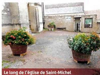
Le long de l'église de Saint-Michel