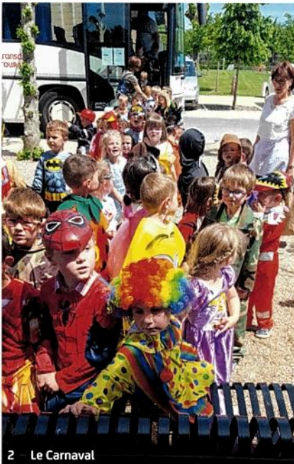
2 Le Carnaval