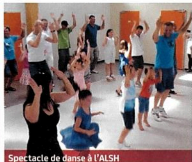
Spectacle de danse à l'ALSH